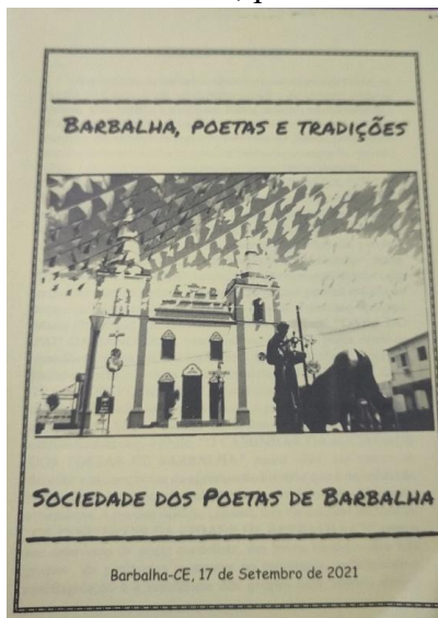
Figura 2 – Barbalha, poetas e tradições

Aqui possibilita o contato com as pessoas mais velhas de cada localidade, as quais sabem sobre essas histórias e possuem acervos que registram alguns fatos importantes. Além disso, o professor pode direcionar visitas as associações comunitárias, o Sindicato dos Trabalhadores/as Rurais de Barbalha, museus e a Escola de Saberes de Barbalha. Ao visitar estes locais podem dialogar sobre fatos e personagens históricos usando folhetos, como Barbalha, poetas e tradições (figura 2), que reúne diálogos sobre Padre Ibiapina, Festa de Santo Antônio em Barbalha, Alto do Leitão, entre outras localidades, personagens e manifestações culturais. Isso possibilita a produção de um roteiro em mapas turísticos de locais pertinentes para o município.