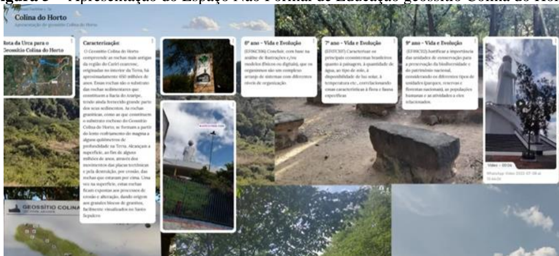
Figura 5 - Apresentação do Espaço Não Formal de Educação geossítio Colina do Horto.

Fonte: Autoral. Link de acesso: Colina do Horto (padlet.com)