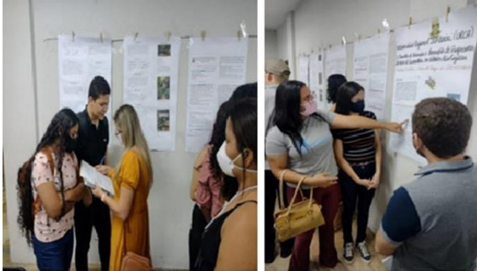
Figura 3 - Varal didático, momento de avaliação e apresentação para validação pelos professores da Educação Básica.