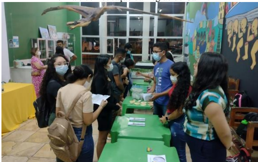
Figura 4 – Apresentação das práticas pedagógicas para o ensino de Ciências em Espaços Não Formais de Educação da Região do Cariri.