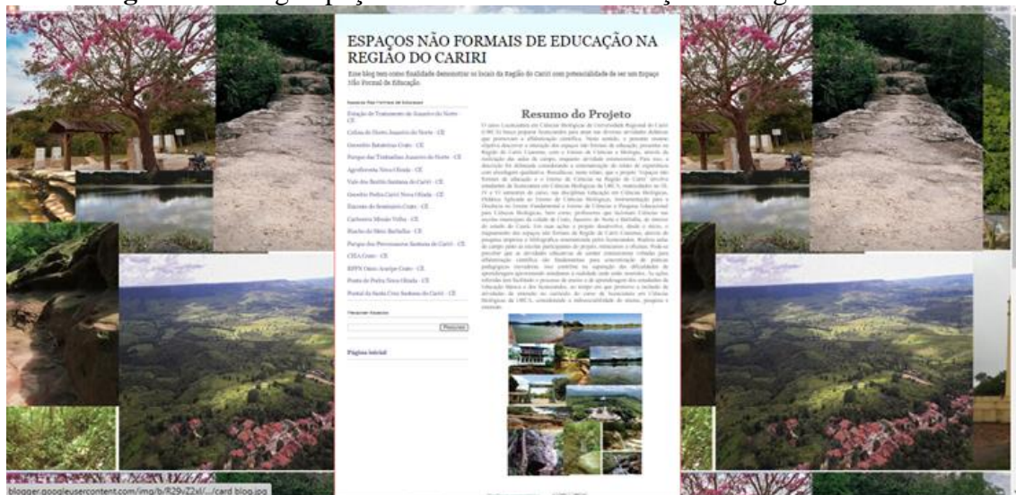
Figura 1 - Blog Espaços Não Formais de Educação na Região do Cariri

Fonte: Autoral. Link de acesso - https://espacosnaoformaisdeeducacao.blogspot.com/