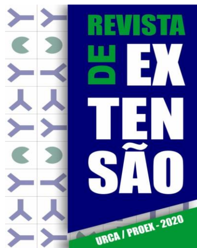
Figura I – 1ª Edição da Revista de Extensão