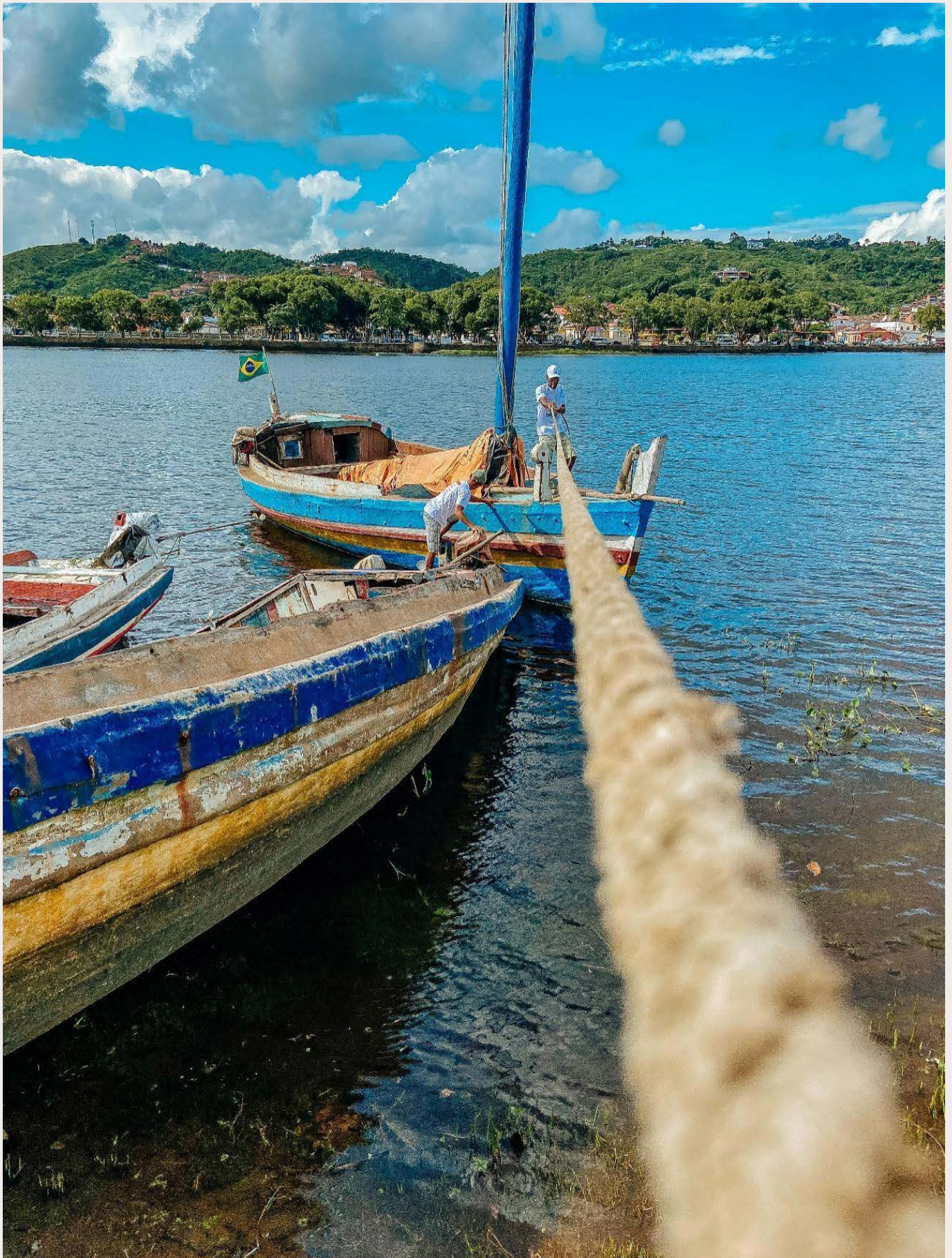
Figura 2: a memória que luta contra o tempo