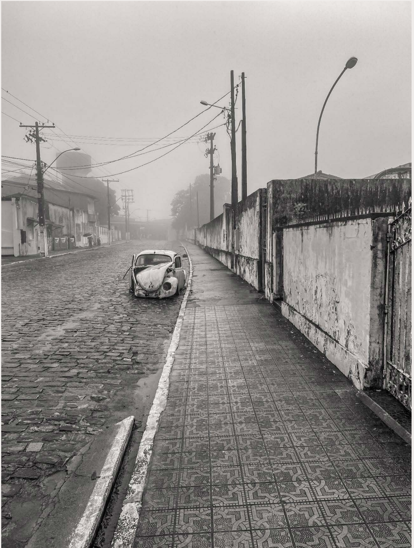
Figura 1: uma neblina de incertezas que sorri serenamente enquanto uma revoada de borboletas pinta o céu