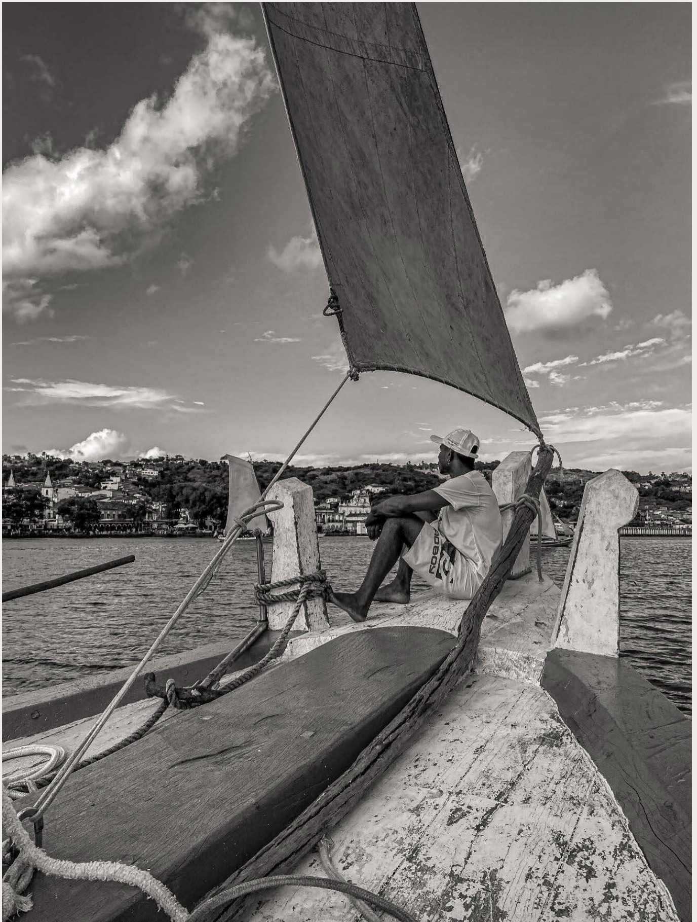
Figura 4: o horizonte segue intocável