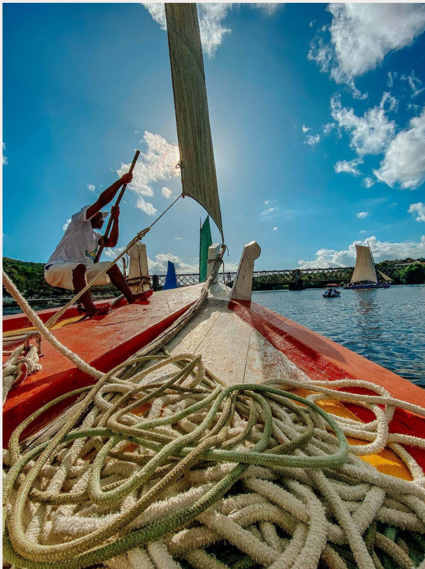
Figura 3: algo se vai, algo que fica