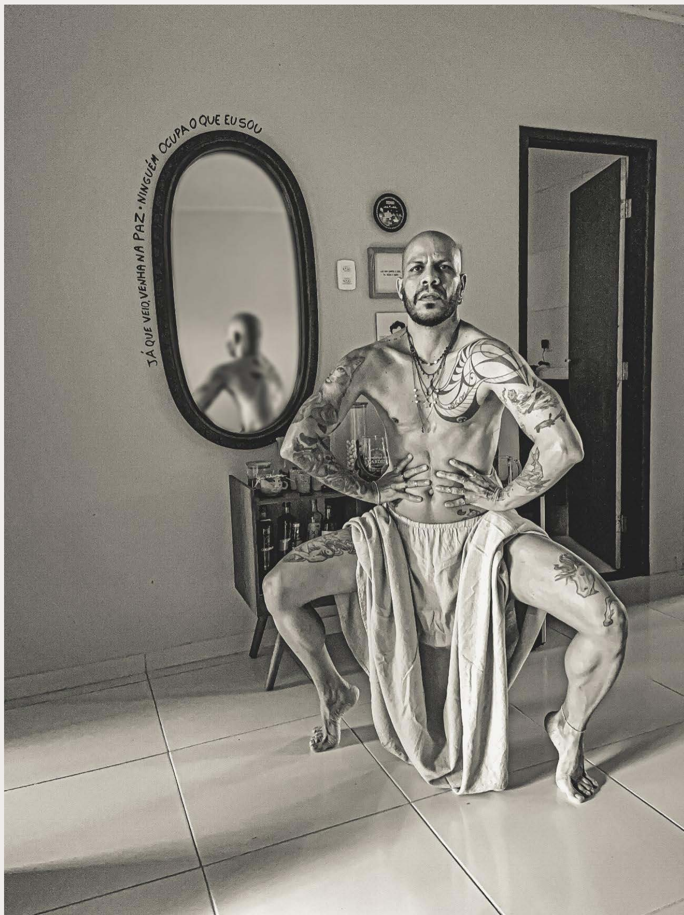
Figura 5: um corpo amarrotado, torcido que luta para manter-se agregado aos mais diversos ambientes