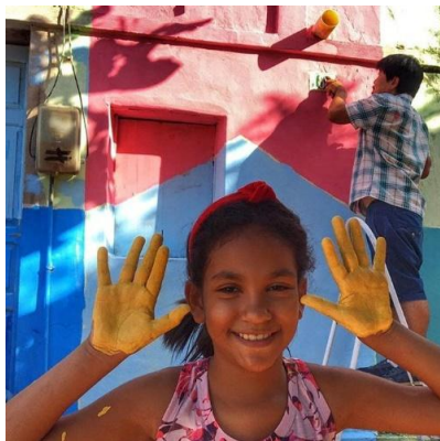
Figura 9 – Intervenção de pintura em fachada feita na Comunidade do Gesso – Crato/CE. Realizada pela população local junta ao Coletivo Camaradas.