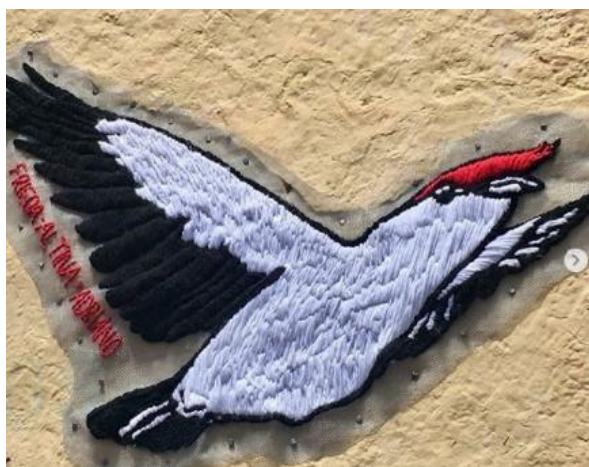
Figura 6 – As artes do coletivo são percebidas em algumas ruas no centro da cidade do Crato, a exemplo, o bordado a seguir é de uma ave característica da região: o soldadinho de Araripe (macho).