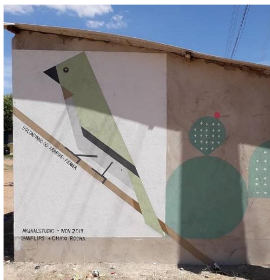
Figura 8 – Intervenção de pintura em parede, feita na Comunidade do Gesso – Crato/CE. Ação realizada por civis por intermédio do Coletivo Camaradas. Na Imagem podemos observar uma representação de um pássaro nativo da região, o soldadinho do Araripe (fêmea).