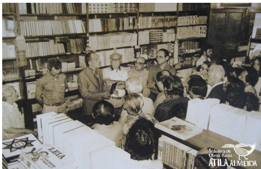
Imagem 1: Lançamento do livro Bruxaxá