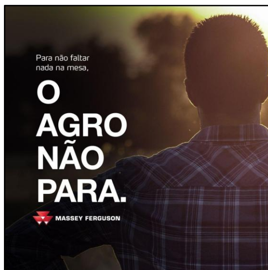
Figura 3 – Texto 3: Campanha publicitária da empresa Massey Ferguson sobre o agronegócio

A empresa Massey Ferguson , reconhecida pelo pioneirismo e inovação em máquinas agrícolas há mais de sessenta anos no Brasil, veiculou ao seu Instagram (@masseyfergusonbr) a terceira peça publicitária demonstrada abaixo.