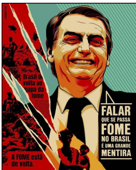
Figura 2 – Texto 2: Jair Bolsonaro a respeito da fome

A segunda propaganda publicitária a ser analisada foi produzida pelo ilustrador paulista Cristiano Siqueira (@crisvector) e veiculada ao Instagram no ano de 2019. O texto multimodal estampa a imagem do então Presidente da República, Jair Bolsonaro (PL), acompanhada de um texto verbal, evidenciando a temática política como ponto-chave a ser discutido.