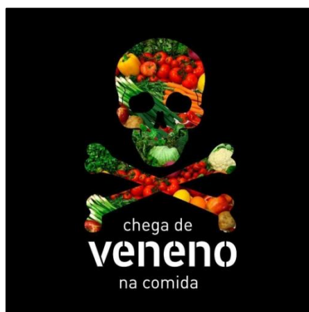
Figura 1 – Texto 1: Campanha contra o uso de agrotóxicos

Com o intuito de propagar uma mensagem de alerta e de resistência no que se refere ao uso de agrotóxicos nas plantações agrícolas, a peça publicitária desenvolvida pelo coletivo de arte urbana de São Paulo, BijaRi (@_bijari), e publicada no Instagram em 2018, estampa uma campanha para o Dia Mundial de Combate ao Uso de Agrotóxico (3 de dezembro), conforme análise da figura 1, a seguir.